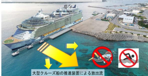
大型クルーズ船の推進装置による放出流